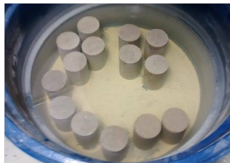
Figura 2 – Processo de cura úmida por 28 dias

Todos os corpos de prova foram curados durante 28 dias pelo processo de cura úmida, Figura 2, e posteriormente submetidos ao ensaio de compressão axial segundo a norma NBR 5739/1994.