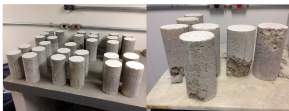
Figura 1 – Corpos de prova

Foram preparados 12 corpos de prova de diâmetro ( \Phi ) = 10 cm por 20 cm de altura, como apresentado na figura Figura 1, sendo 4 desses preparados sem o pó do tecido, 4 preparados com 5% de pó em relação à massa de cimento e mais 4 preparados com 15% de pó em relação à massa de cimento. Todos corpos de prova foram fabricados segundo a NBR 5738/1994 [2].